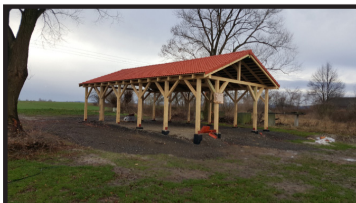
Mieszkańcy Przybyłowic współuczestniczą w budowie wiaty również przy udziale finansowym gminy