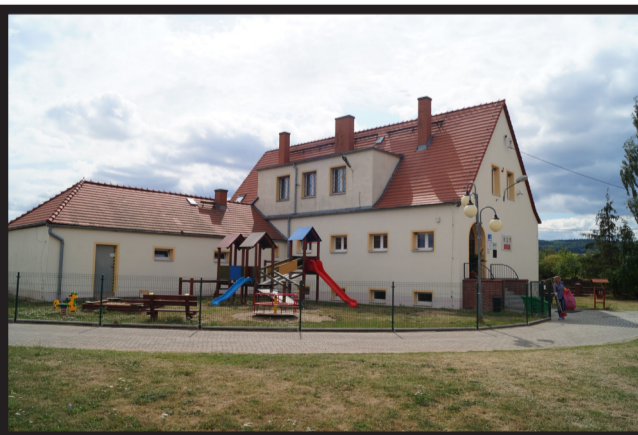
Remont przedszkola w Męcince