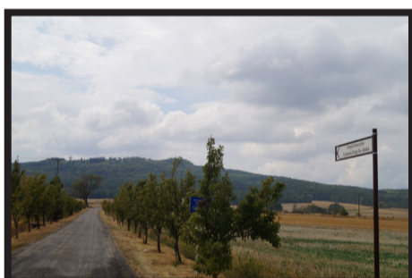
Remont drogi kalwaryjskiej w Męcince