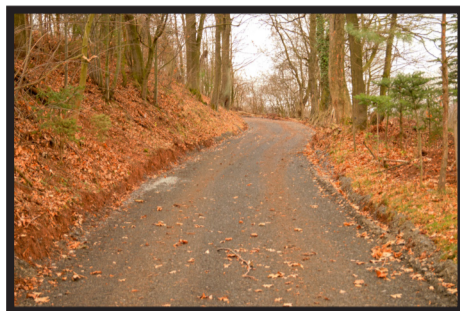
Drogi w Kondrtowie