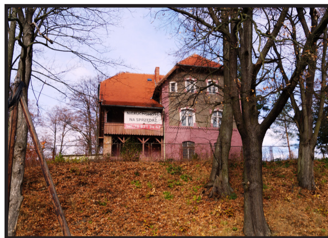
Budynek po byłym ośrodku zdrowia w Pomocnem na wzgórzu z widokami na Pogórze i Góry Kaczawskie, wieś z punktem lekarskim, punktem przedszkolnym, kościołem, placem zabaw, boiskiem sportowym oraz świetlicą wiejską.