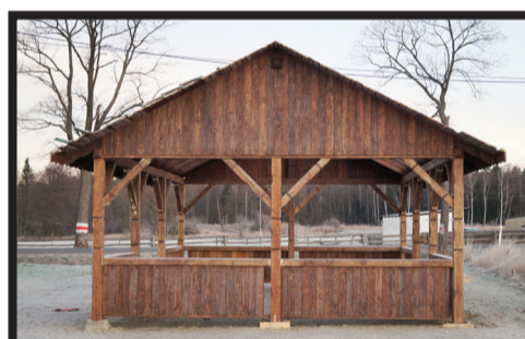
Wiata w Muchowie