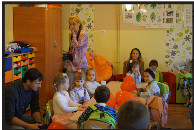
Remont i wyposażenie przedszkoli w Męcince i Piotrowicach

Utworzonych zostało 5 oddziałów. Zatrudniono dziesięć dodatkowych osób z terenu Gminy Męcinka. Obecnie w przedszkolach tych przebywa 105 dzieci. Oprócz tego utrzymany został punkt przedszkolny w Pomocnem.