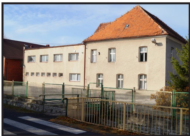
Budynek po byłej szkole w Piotrowicach, wieś z gminnym ośrodkiem zdrowia, szkołą, kościołem, świetlicą wiejską, apteką, boiskiem sportowym, zabytkowym parkiem i stawem, a także restauracją i sklepami spożywczymi.