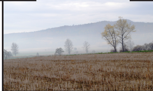
Działki budowlane w Nowej Męcince z widokiem na wygasły wulkan z zabytkową Kalwarią, nieopodal Męcinki, w której funkcjonuje Zespół Szkół wraz z przedszkolem, nowy ośrodek zdrowia. W Męcince znajduje się Urząd Gminy, kościół, ochotnicza straż pożarna, kompleks rekreacyjno – sportowy z kortem tenisowym, boiska sportowe, Gminna Biblioteka Publiczna, GOPS, sklepy spożywcze.

Szczegóły i kontakt pod nr. telefonu : (76) 871 34 47