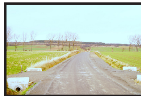
Przebudowa drogi w Męcince

Na przebudowę drogi w Piotrowicach pozyskano dotację z budżetu państwa 320 397 zł oraz dotację z TFOGR 199 500 zł.