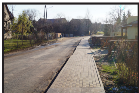
Budowa chodnika przy drodze powiatowej w Piotrowicach

Na przebudowę drogi w Piotrowicach pozyskano dotację z budżetu państwa 320 397 zł oraz dotację z TFOGR 199 500 zł.