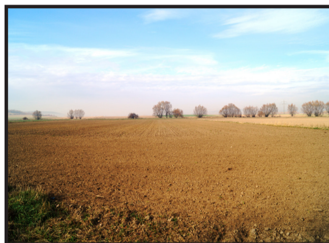
Działki budowlane w Piotrowicach z widokiem na Pogórze Kaczawskie, wieś z gminnym ośrodkiem zdrowia, szkołą, kościołem, świetlicą wiejską, apteką, boiskiem sportowym, zabytkowym parkiem i stawem, a także restauracją i sklepami spożywczymi.