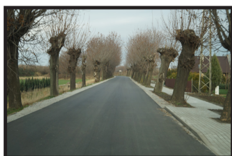
Przebudowa drogi oraz budowa chodnika w Piotrowicach