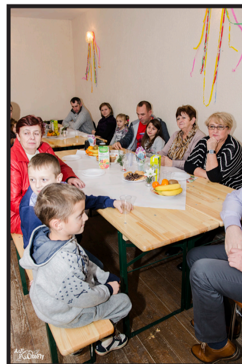
Spotkanie Mikołajowe w Stanisławowie