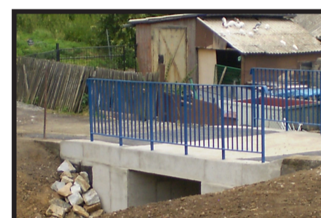
Mostek w Sichowie