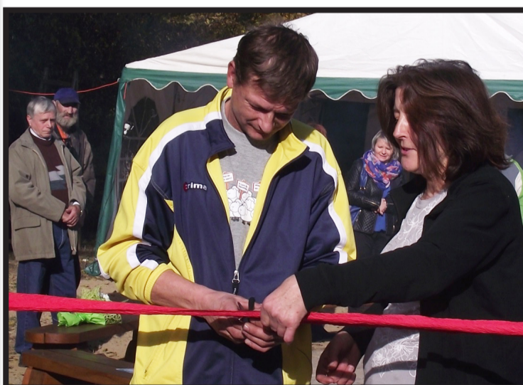
Mieszkańcy Pomocnego utworzyli miejsce spotkań i integracji.