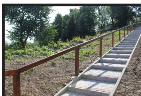
Budowa chodnika w Słupie