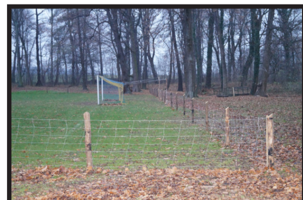
Mieszkańcy Sichowa ogrodzili boisko w zabytkowym parku.