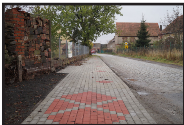
Mieszkańcy Przybyłowic przy wsparciu finansowym Gminy Męcinka wykonali samodzielnie chodnik.