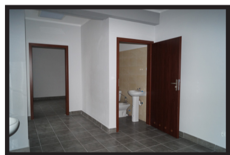
Nowy ośrodek zdrowia w Męcince