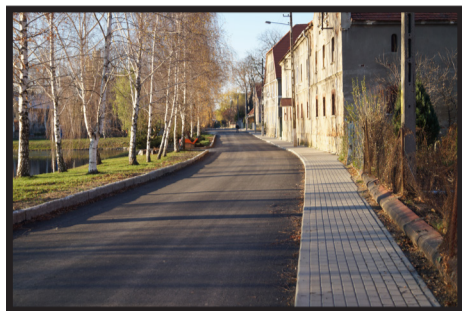
Przebudowa drogi w Małuszowie wraz z budową chodnika

robót w ramach inwestycji w Małuszowie i pozyskania dodatkowej kwoty dotacji tj. 78 539 zł. Na tą inwestycję pozyskano również dotację z TFOGR 164 000 zł.