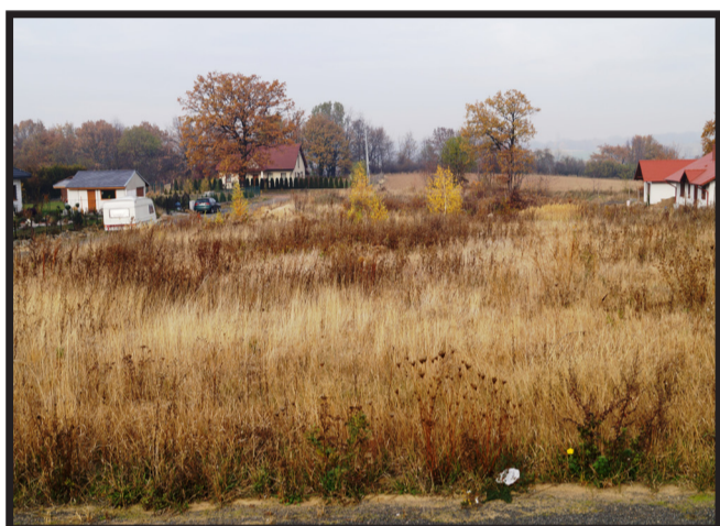
Działki budowlane w Słupie nieopodal zbiornika wodnego, w miejscowości znajduje się pocysterski kościół, świetlica wiejska, plac zabaw oraz sklep spożywczy.